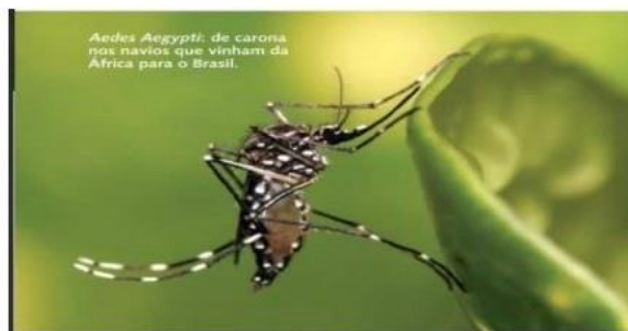
Aedes Aegypti , de coroa, nos navios que vinham da África para o Brasil.