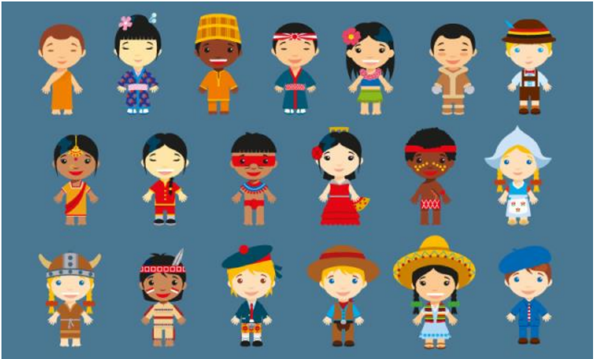
Esse é somente um exemplo.