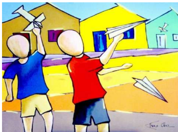
Artista plástico Ivan Cruz retrata em suas obras as brincadeiras de infância como os aviões de papel