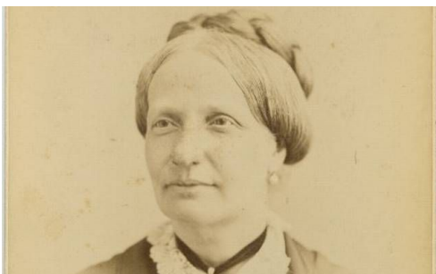
Imperatriz Teresa Cristina