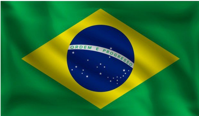
Bandeira do Brasil