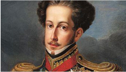
Dom Pedro I