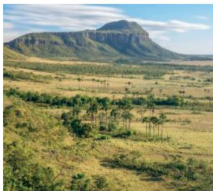
Cerrado e morro do Buracão ao fundo, no Parque Nacional da Chapada dos Veadeiros, estado de Goiás. Fotografia de 2016.