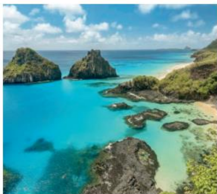
Ilha de Fernando de Noronha, no estado de Pernambuco. Na fotografia, as ilhas Dois Irmãos, em 2016.