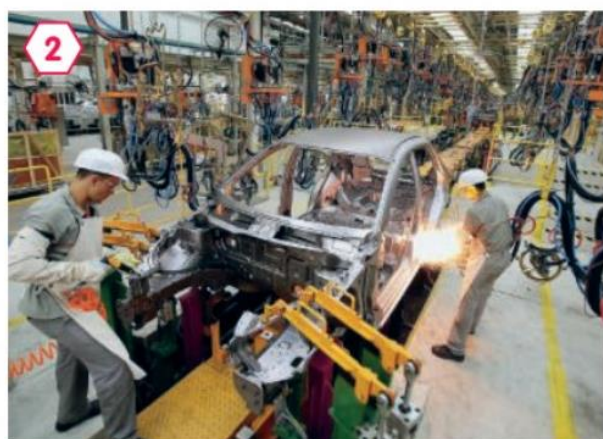
2 Linha de montagem de indústria automobilística em Jacareí, no estado de São Paulo, em 2015.