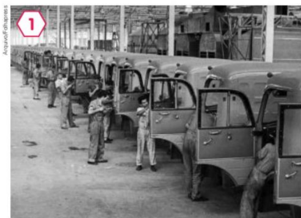
1 Linha de montagem de indústria automobilística em São Bernardo do Campo, no estado de São Paulo, em 1958.

Realize as questões do livro, as questões orais devem ser registradas no livro ou no caderno;