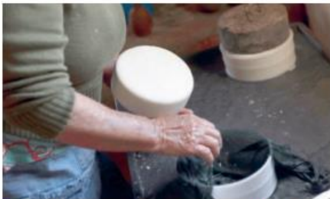
➤ Produção artesanal de queijo na região da Serra da Canastra, no estado de Minas Gerais. Fotografia de 2016.