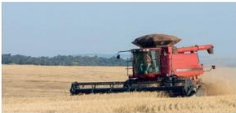
➤ Colheita mecanizada de trigo em Nova Fátima, no estado do Paraná. Fotografia de 2015.