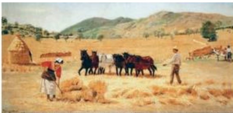
➤ Ceifa em Anticoli, de Pedro Weingärtner, 1903 (óleo sobre tela, de 50 cm x 100 cm).