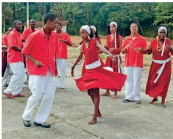
➤ Grupo de jongo da cidade de Piquete, no estado de São Paulo. Fotografia de 2017.