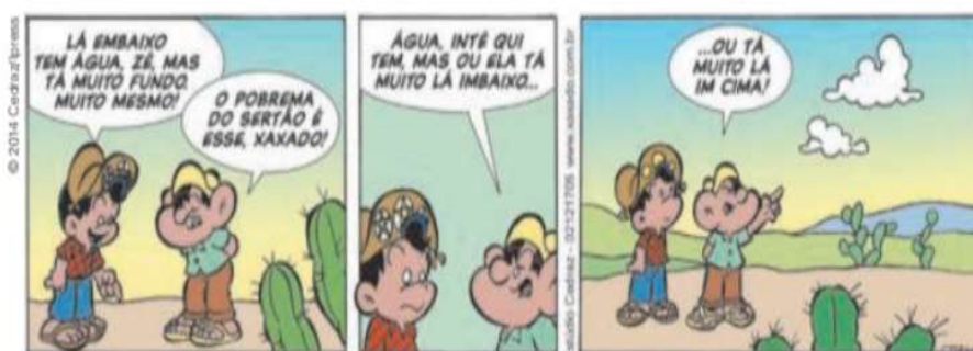
CEDRAZ, Antônio. Xaxado. A Tarde , Salvador, maio de 2005.