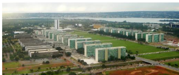
Imagem 2: Esplanada dos Ministérios em Brasília, em 2006.