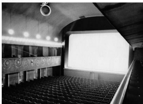
Reprodução de uma sala de cinema em meados do século XX.