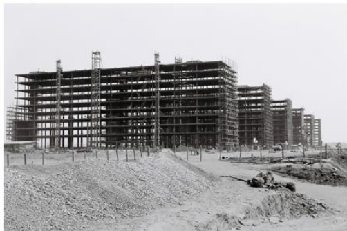
Imagem 1: Esplanada dos Ministérios em Brasília, em 1959.