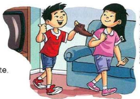
Ilustração: Camille/Arquivo da Editora

5. Sublinhe os advérbios das frases e classifique-os.