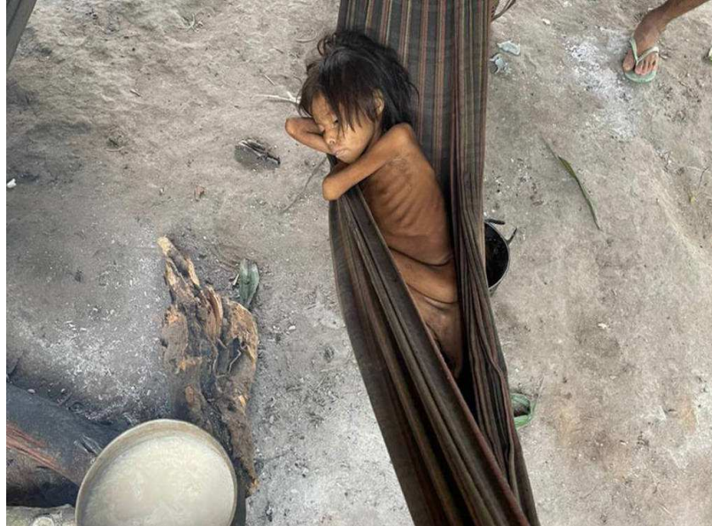
IMAGEM DE UMA CRIANÇA INDIA DESNUTRIDA