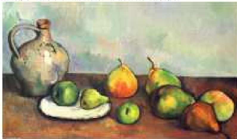
Obra de Arte

Faça a releitura da obra "Natureza morta bilha e Fruta", 1894 por Paul Cezanne.( Releitura é o desenho de como você está vendo a obra).