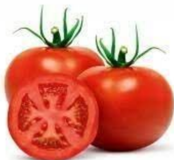
TOMATE COR: VERMELHO TAMANHO: PEQUENO FORMATO: REDONDO QUAL É A FRUTA?