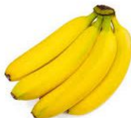
BANANA COR: AMARELO TAMANHO: MÉDIO FORMATO: COMPRIDO QUAL É A FRUTA?