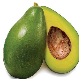
ABACATE COR: VERDE TAMANHO: MÉDIO FORMATO: OVAL QUAL É A FRUTA?