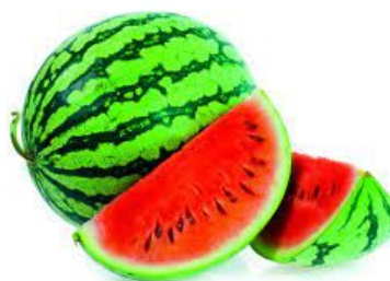
MELANCIA COR: VERDE E VERMELHO TAMANHO: GRANDE FORMATO: REDONDO QUAL É A FRUTA?