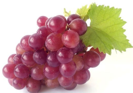
UVA COR: ROXA TAMANHO: BEM PEQUENO, COM VÁRIOS. FORMATO: REDONDO QUAL É A FRUTA?