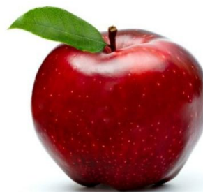
MAÇÃ COR: VERMELHA TAMANHO, PEQUENO FORMATO: REDONDO QUAL É A FRUTA?