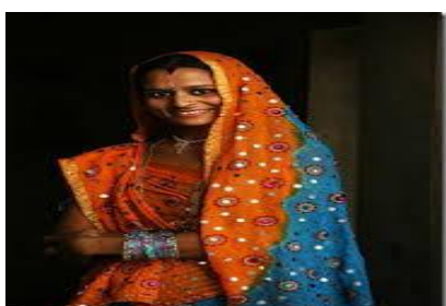
“Sari” (ou “saree”)