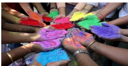
“Festival das cores Holi”.

CAMPO DE EXPERIÊNCIA: Utilizar materiais variados com possibilidades de manipulação (argila, massa de modelar), explorando cores, texturas, formas e volumes, etc, ao criar objetos tridimensionais.