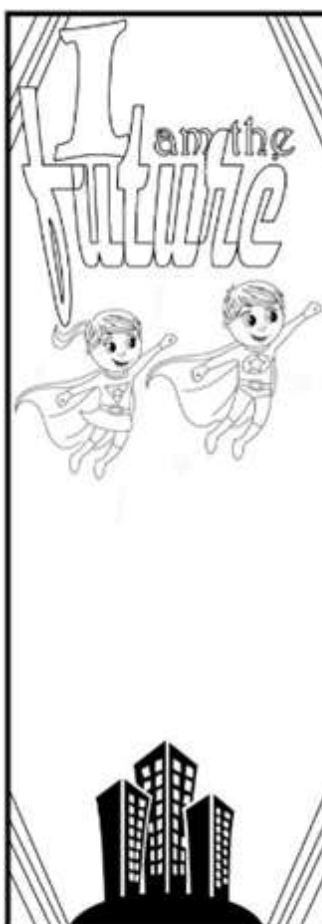
"EU SOU O FUTURO"