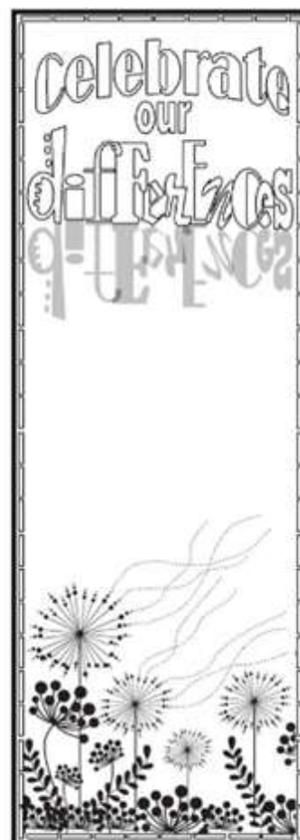
"CELEBRAR NOSSAS DIFERENÇAS"