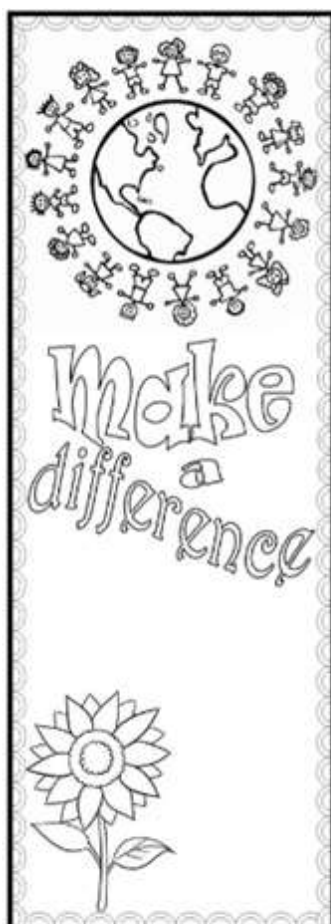
"FAÇA A DIFERENÇA"

BEM LEGAL SOBRE SER CRIANÇA! SE POSSÍVEL, PEÇA AJUDA OU PESQUISE PARA ESCREVÊ-LA EM INGLÊS!