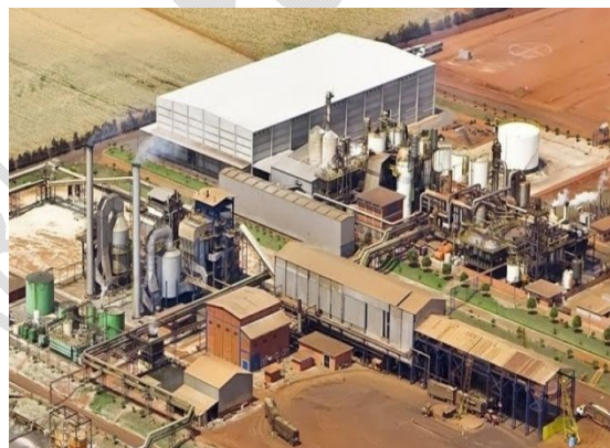
Usinas de hoje.