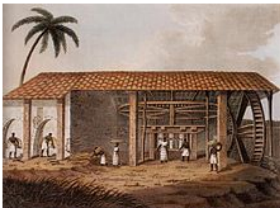
Engenhos do século passado.