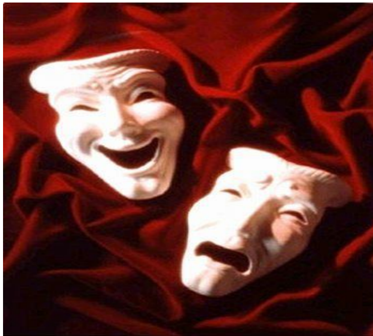
“comédia” e “tragédia”

AS MÁSCARAS SEMPRE FORAM PRESENTES NA HUMANIDADE, SEJA EM FESTAS, EM RITUAIS NA ANTIGUIDADE E ATÉ MESMO NO TEATRO, USADA PARA REPRESENTAR AS EMOÇÕES DAS PERSONAGENS.