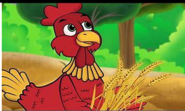
A GALINHA RUIVA – OS AMIGUINHO

PARA ENCERRARMOS NOSSA ATIVIDADE, VAMOS OUVIR UMA HISTÓRIA DE DELEITE. RELAXEM E APROVEITEM.