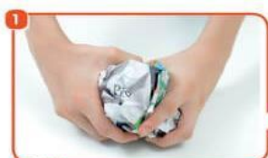
1 FAÇA UMA BOLA COM AS FOLHAS DE JORNAL.