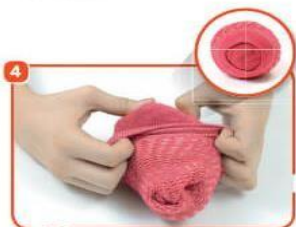
4 ENVOLVA A BOLA COM A PONTA DA MEIA E ELA ESTARÁ PRONTA!