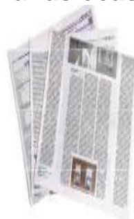
FOLHAS DE JORNAL