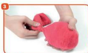
3 TORÇA A MEIA BEM PRÓXIMO À BOLA.