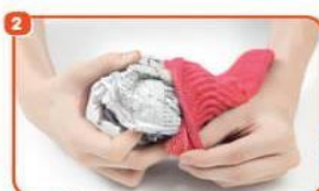
2 COLOQUE A BOLA DE JORNAL DENTRO DA MEIA.