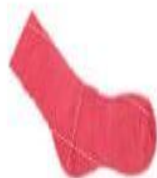
MEIA DE CANO LONGO